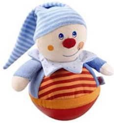
HABA 5849 Stehauffigur Kasper,